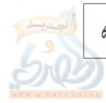
صورتان يظهر فيهما جزء من مقال الشيخ أبي زهرة عن مسند الإمام أحمد