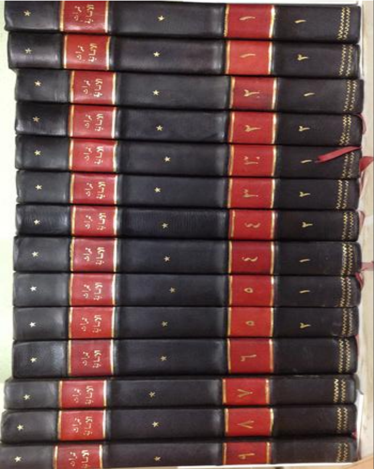
صورة للمجلة في نشرتها الأخيرة بعد ضم أعدادها في مجلدات تبلغ (١٤) مجلدًا