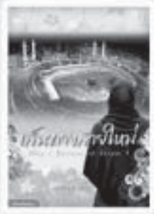
เส้นทางสายใหม่ Why I Believe in Islam