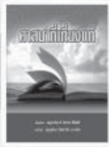
ศาสนาที่เกี่ยวข้อง