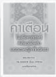
คำเตือนในเรื่องศรัทธา ที่เกี่ยวข้องกับบรรดาเทพ ที่ศรัทธา