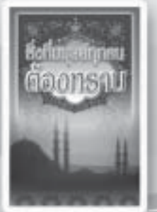
สิ่งที่มนุษย์ทุกคน ต้องทราบ