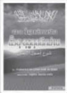
อธิบายพื้นฐาน หลักการศรัทธา ฮีรุล อูตุลอุลุมาน