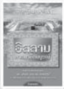
อิสลาม ศาสนาที่สมบูรณ์