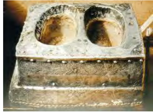
مقام إبراهيم في مكة المكرمة.