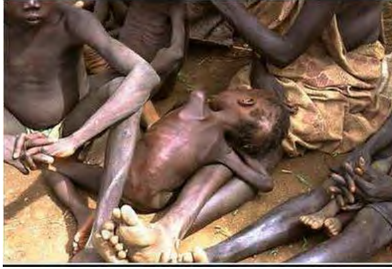
صور للمجاعة في السودان