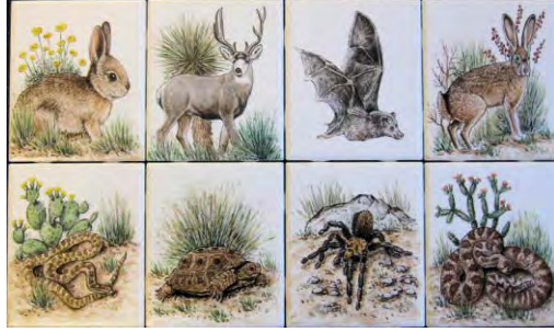
بعض حيوانات البيئة الصحراوية

لا جرمَ كانوا أهل هذه اللغة المعجزة، التي ناسبتهم بأوضاعها في معاني التركيب، حتى كأنما كتب لها أن تكونَ دينَ الألسنة الفطري، لتصلح بعد ذلك أن تكون لسان دين الفطرة". 39