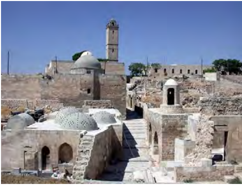
مقبة أبي الأنبياء إبراهيم عليه السلام في الخليل.

وجدير بالذكر أن جميع الأنبياء والمرسلين المذكورين في القرآن هم من الشعوب السامية، وهم إما من العرب، أو عاشوا على الأرض العربية، أو من أبناء عمومة العرب 21 ، والله أعلم.