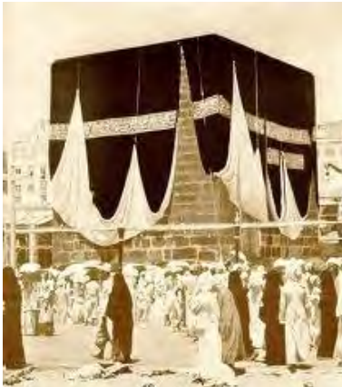
الصُّحْبَةُ رَمَزٌ لِلْعَدَالَةِ وَالْمَسَاوَاةِ

وكان للعرب حظ من الحضارة، بل كانوا سابقين إليها قبل الروم والفرس، فلم يكونوا رعاغاً كما يصورهم أعداؤهم، فإن قدمهم بالحضارة أثبت من غيرهم، وفي هذا السياق يقول غوستاف لوبون: "وإذ كان عرب الحيرة وغسان متصلين بالفرس والرومان، كان تأثير هؤلاء في حضارة أولئك كبيراً، وغير ذلك أمر حضارة اليمن العربية التي هي أقدم من حضارة الرومان، والتي يجب أن يُبحث فيها عن بقايا حضارة العرب القديمة، والتي نأسف على بقائها بعيدة من يد البحث والتنقيب