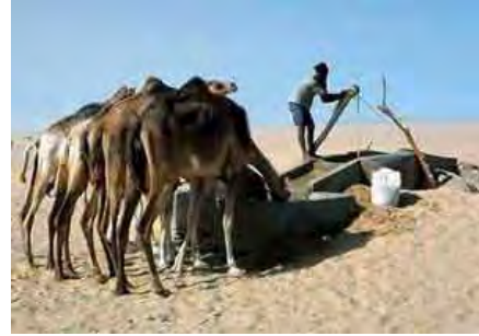
بئر تقليدية في الصحراء