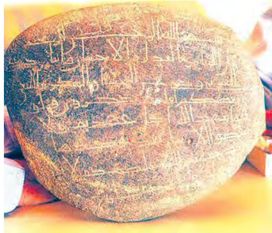
تاريخنا منقوش على الحجر

وكان للعرب تواريخ عدة قبل الإسلام، وأما بعد الإسلام فقد اتفقوا أن يبدأ التاريخ بالهجرة النبوية، لأنها الفيصل بين عهدين، ومبدأ عزة الإسلام، قال الألويسي نقلاً ملخصاً عن الصولي: "فأما العرب فكانوا يؤرخون بالنجوم قديماً، وهو أصل، ومنه صار الكتاب يقولون: نجمت على فلان كذا حتى يؤديه في نجوم، وأنجمة جمع نجوم، والعرب تخص بالنجم الثريا... وكانت العرب تؤرخ بكل عام يكون فيه أمر مشهور متعارف، فأرخوا بعام الفيل، وفيه ولد النبي صلى الله تعالى عليه وسلم... وأرخت العرب بعام الخنن لأنهم تماوتوا فيه، وعظم عندهم أمره... وأرخت قريش بموت هشام بن المغيرة المخزومي لجلالته فيهم... وروي عن الزهري والشعبي أن بني إسماعيل أرخوا من نار إبراهيم عليه السلام إلى بنائه البيت حين بناه مع إسماعيل، وإن بني إسماعيل أرخوا من بنیان البيت إلى تفرق معد، (فكان كلما خرج قوم أرخوا بمخرجهم، ومن بقي بتهامة من بني إسماعيل يؤرخون من خروج سعد ونهد وجهينة بني زيد من تهامة) ثم كانوا يؤرخون بشيء شيء إلى موت كعب بن لؤي، ثم أرخوا بعام الفيل، إلى أن أرخ عمر بن الخطاب رضي الله تعالى عنه من هجرة النبي صلى الله تعالى عليه وسلم، وكان سبب ذلك أن أبا موسى كتب إليه: إنه يأتينا من أمير المؤمنين كتب ليس لها تاريخ، فلا ندري على أيها نعمل!" 42 .