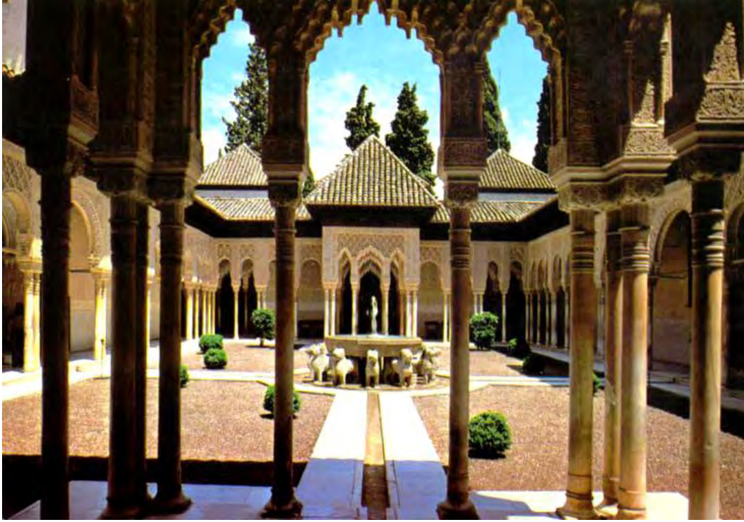
قصر الحمراء في الأندلس شاهد على عظمة الحضارة الإسلامية