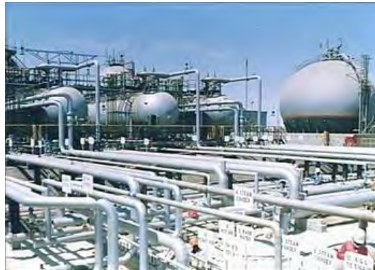
مصفاة بترول رأس تنورة فينا

يجب على العرب أن يسهموا في إنقاذ العالم من نظم الجشع الرأسمالية، التي باتت أكثر تسلطاً على الناس بعد انسحاب الشيوعية، وتفردتها في قيادة الأسواق العالمية... إن محاربة الفقر والاستغلال، وجريمة الربا من جهة، والبذل والسخاء والعمل الجاد، ورعاية الطبقات الكادحة من العمال والفلاحين من جهة أخرى، كل هذه أمور يجب أن يتولاها العرب من أجل مساعدة الناس على حياة اقتصادية سليمة، تنهي استغلال الإنسان لأخيه الإنسان.