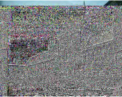
المسجد الأموي بدمشق

من فضل الله على العرب أن جعل أرضهم هي أرض النبوات والملاحم والبداية والنهاية، فقد ورد في الحديث النبوي قصة الدجال وفتنته العظيمة، وأن عيسى بن مريم يقتله بفلسطين، ولكن من أين يبدأ عيسى رحلة التطهير؟، إنه يبدأ من دمشق، حيث يتزل فيها، ففي الحديث عنه صلى الله عليه وسلم: (...فبينما هو كذلك - أي الدجال - إذ بعث الله المسيح بن مريم، فيتزل عند المنارة البيضاء،