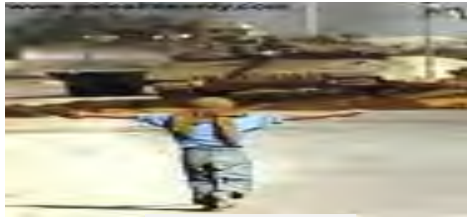
شجاعة الأحرار في الدفاع عن فلسطين

هكذا كانت شجاعة العرب وحروبهم الداخلية فيما بينهم مقدمة لتهيئتهم لدور أكبر في التاريخ، وذلك حين وحدهم الله تحت لواء دينه، فتحوّلت حروبهم الداخلية إلى حروب خارجية، وصارت فتوحات لنشر هذا الدين، وتحرير هذا العالم من العبودية للطواغيت، وتحطيم الأصنام والأغلال التي حالت بين الإنسان والتوحيد والحرية والإبداع في العصور الوسطى. فله هؤلاء العرب الذين جمعوا أسس الأخلاق الزكية!، وهي جودة الرأي، والشجاعة والكرم، وهي أمهات الخلق الحميد كما قال قدامة: "إنه لما كانت فضائل الناس، من حيث إنهم ناس، لا من طريق ما هم مشتركون فيه مع سائر الحيوان، على ما عليه أهل الألباب، من الاتفاق في ذلك، إنما هي: العقل والشجاعة والعدل والعفة". 116