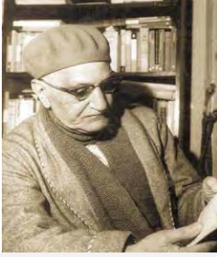
محاس محمود العقاد

وذلك بأن يظهروا للعالم بدائع التراث العربي، وذنخائر الفكر الإسلامي، وعبقرية اللغة والآداب العربية... وأن يقدموا له ما جادت به عبقریات كتابهم في العصر الأخير، فالعرب لهم بصمة فكرية مميزة، فهم يؤمنون بالفكر التحليلي والمنهج العلمي من جهة، ويستضيئون بوحى السماء من جهة أخرى، فتستنير عقولهم، وتصل للحقائق عبر الرؤى الغيبية والتجارب الواقعية، فهم ليسوا مجرد عقلايين لا يؤمنون بالغيب!