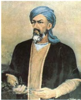
ابن سينا - من أعلام الطب

فمن تكامل حضارتهم أن اجتمعت فيها عناصر شتى لم تجتمع لغيرهم، من ذلك: التمدن المتفوق، والدين القويم الحي، والدولة العظيمة، والعلوم والاختراعات، والتأثير في أوروبا وتمدينها، يقول غوستاف لوبون: "إن الأمم التي فاقت العرب تمدناً قليلة إلى الغاية، وإننا لا نذكر أمة كالعرب، حققت من المبتكرات العظيمة في وقت قصير مثل ما حققوا، وإن العرب أقاموا ديناً من أقوى الأديان التي سادت العالم، أقاموا ديناً لا يزال تأثيره أشدَّ حيويةً مما لأيّ دينٍ آخر، وإنهم أنشأوا من الناحية السياسية، دولةً من أعظم الدول التي عرفها التاريخ، وإنهم مدّنوا أوربة ثقافة وأخلاقاً، فالعروقات التي سمت سموا العرب وهبطت هبوطهم نادرة، ولم يظهر كالعرب عرقٌ يصلح أن يكون مثلاً بارزاً لتأثير العوامل التي تهيمن على قيام الدول وعظمتها 176 وانحطاطها".